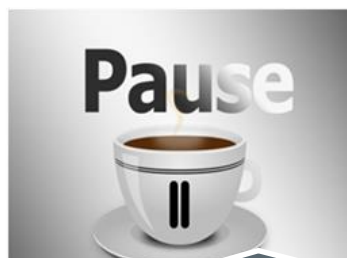
Coffee y Lunch Breaks